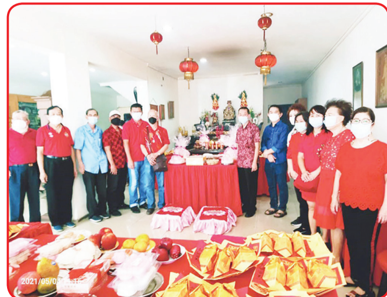
Yayasan Sosial Laut Selatan Jakarta mengadakan upacara sederhana untuk merayakan hari kelahiran Dewi Mazu.