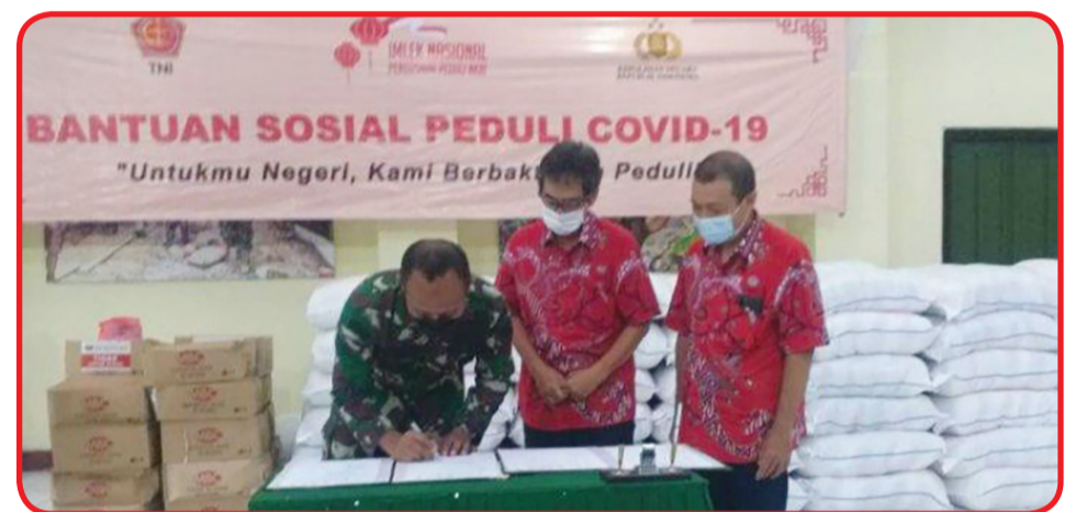
Perwakilan PSMTI Magelang menyerahkan bantuan sosial kepada Kodim 0705/Magelang.

kondisi yang cukup memprihatinkan sehingga peringatan imlek dilakukan dengan sangat sederhana," ujarnya. Dia juga berharap bantuan sosial ini dapat meringankan beban masyarakat akibat efek pandemi Covid-19 yang belum kunjung usai. Bantuan yang berbentuk paket sembako diharapkan bisa mengurangi beban masyarakat terdampak Covid-19. Sedangkan bantuan masker merupakan bentuk upaya memutus penyebaran virus korona. "Semoga bantuan sembako yang kami bagikan dapat meringankan beban masyarakat," pungkasnya. • idn/din