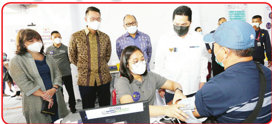
Menteri BUMN Erick Thohir didampingi CEO Lippo Karawaci John Riady berbincang dengan salah seorang peserta vaksinasi Gotong Royong.

Siloam dan selebihnya diselenggarakan di mal-mal yang dikelola oleh anak usaha. Sampai minggu ketiga bulan Mei 2021, Siloam telah melakukan vaksinasi Covid-19 kepada lebih dari 111 ribu orang yang terdiri dari tenaga kesehatan, lansia, tenaga pendidik, ASN, pelaku usaha UMKM dan profesi lainnya. • jhk/din