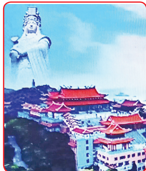
Kompleks Kuil Mei Tianhou menyimbolkan tempat kelahiran budaya Mazu.

kepercayaan Dewi Mazu oleh UNESCO diakui secara resmi sebagai warisan budaya tak benda umat manusia. Sekaligus menjadi warisan kepercayaan dan adat istiadat dunia pertama Tiongkok. • idn/din